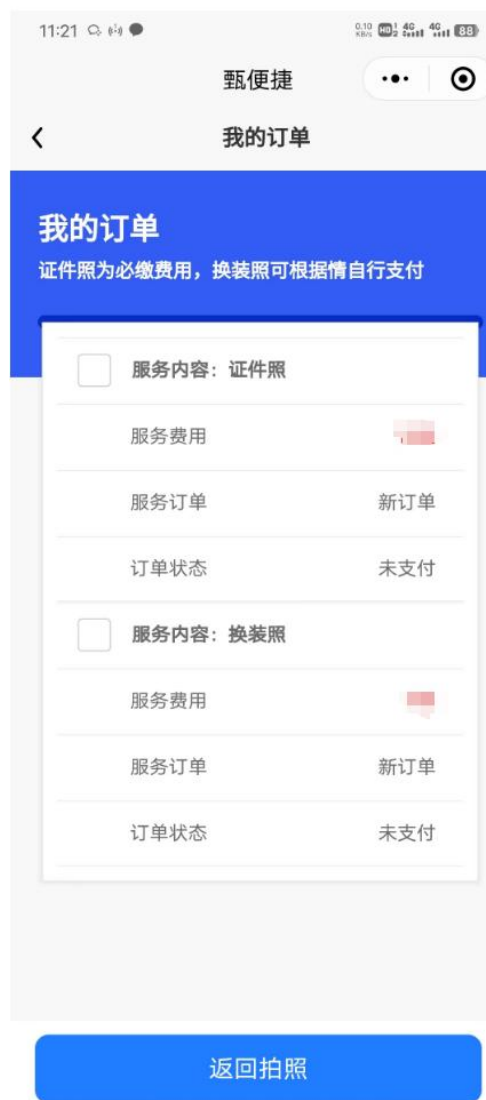
图 3-5-1 我的订单页面